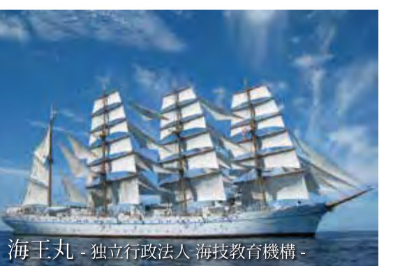
海王丸 - 独立行政法人 海技教育機構