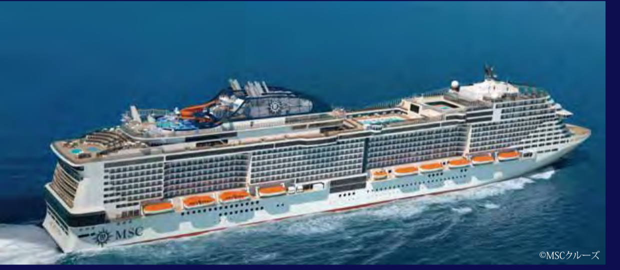
MSCベリッシマ (マルタ) - MSC CRUISES - MSC BELLISSIMA 171,598トン 315.3m 定員5,714人