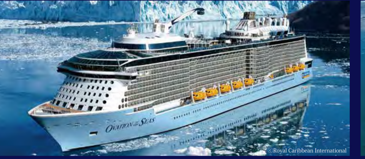
オペレーション・オブ・ザ・シーズ (バハマ) - ROYAL CARIBBEAN INTERNATIONAL - OVATION OF THE SEAS 168,666トン 348m 定員4,180人