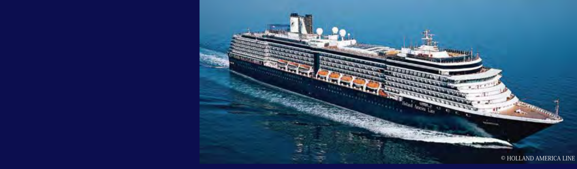
ノールダム (オランダ) - HOLLAND AMERICA LINE - NOORDAM 82,897トン 285.43m 定員1,972人