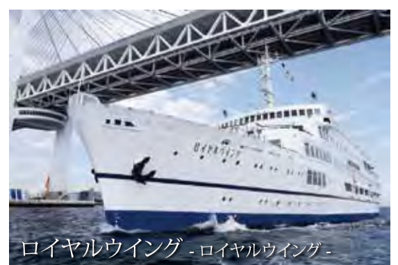
ロイヤルウィング - ロイヤルウィング