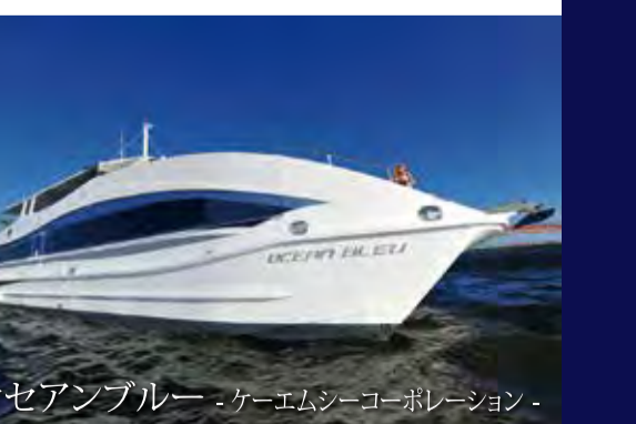
オセアンブルー - ケーエムシーコーポレーション