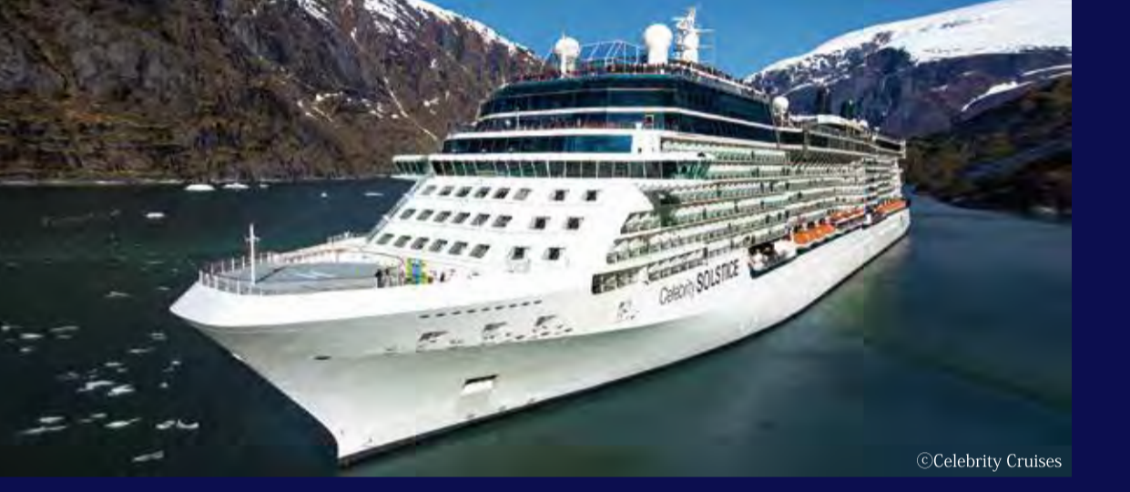
セレブリティ・ソルスティス (マルタ) - CELEBRITY CRUISES - CELEBRITY SOLSTICE 122,000トン 317m 定員2,850人