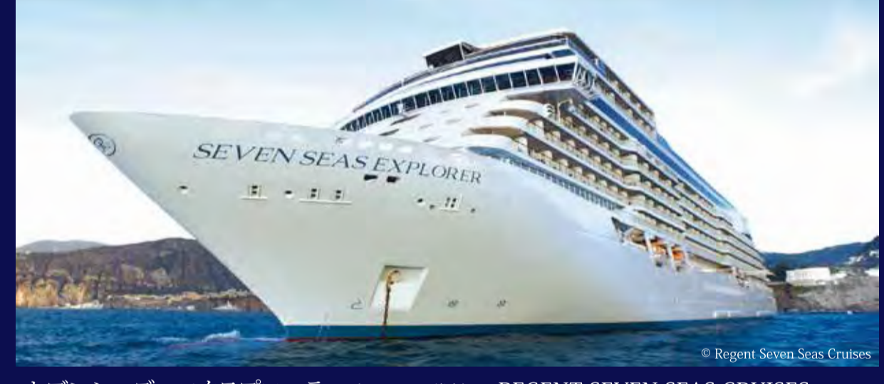
セブンシーズ エクスプローラー (マーシャル諸島) - REGENT SEVEN SEAS CRUISES - SEVEN SEAS EXPLORER 50,125トン 224m 定員750人