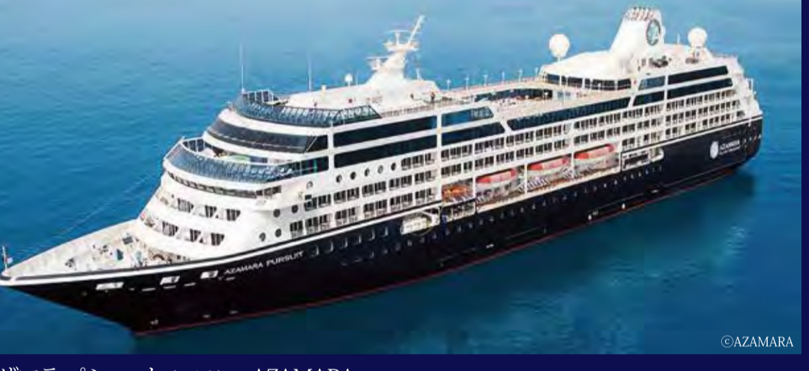
アザマラ パシュート (マルタ) - AZAMARA - AZAMARA PURSUIT 30,277トン 180m 定員702人