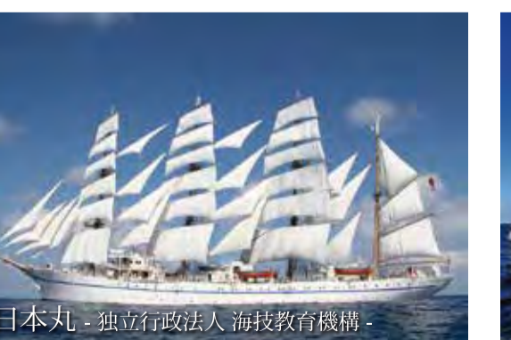
日本丸 - 独立行政法人 海技教育機構