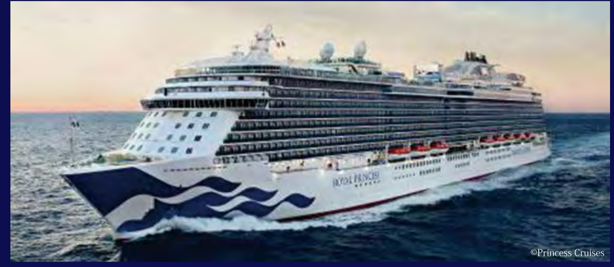
ロイヤル・プリンセス (バミュータ) - PRINCESS CRUISES - ROYAL PRINCESS 142,220トン 330m 定員3,960人