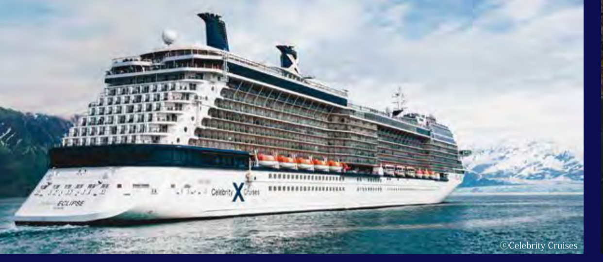
セレブリティ・イクリプス (マルタ) - CELEBRITY CRUISES - CELEBRITY ECLIPSE 122,000トン 317m 定員2,850人