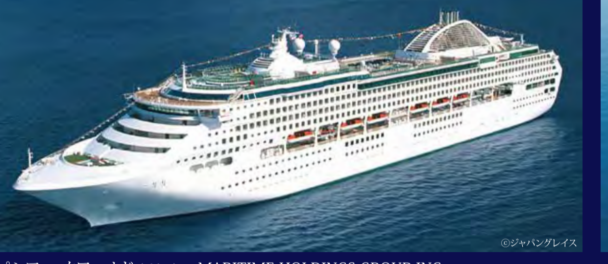
パシフィックワールド (バハマ) - MARITIME HOLDINGS GROUP INC. - PACIFIC WORLD 77,441トン 261.30m 定員2,272人