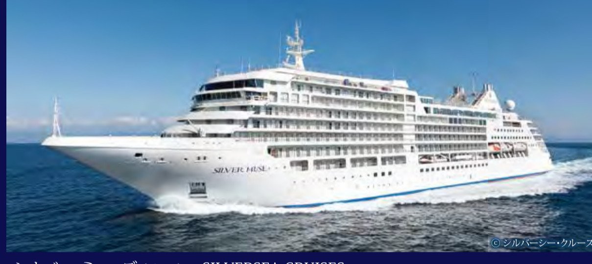
シルバー・ミュージズ (バハマ) - SILVERSEA CRUISES - SILVER MUSE 40,791トン 212.8m 定員596人