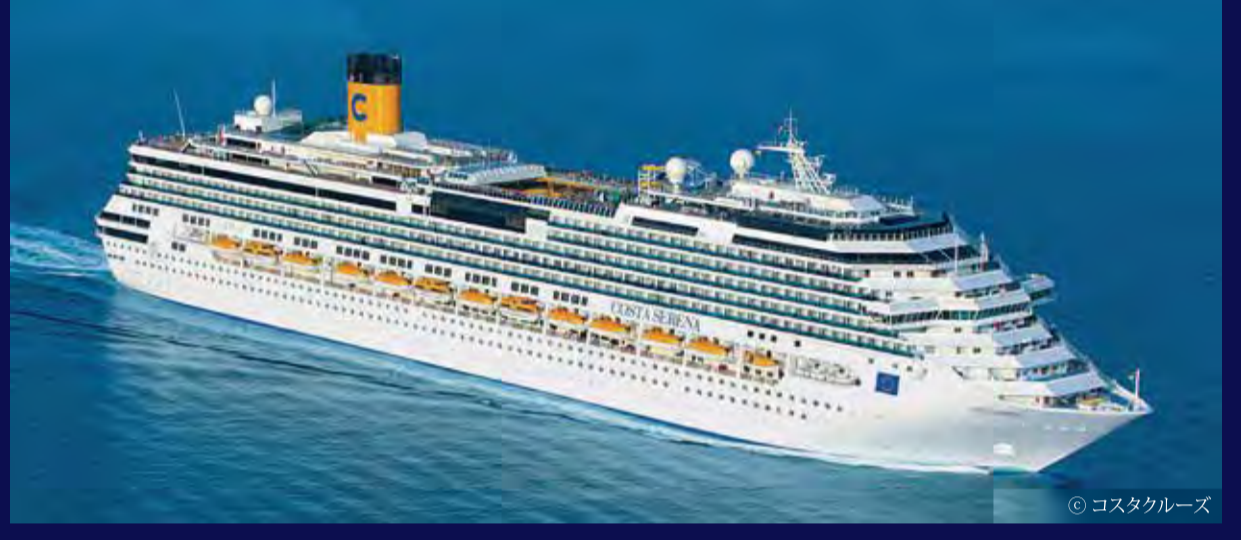
コスタ セレーナ (イタリア) - COSTA CRUISES - COSTA SERENA 114,500トン 290m 定員3,780人