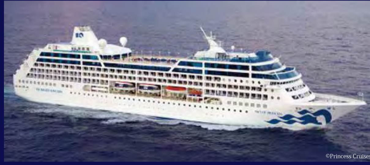
パシフィック・プリンセス (バミュータ) - PRINCESS CRUISES - PACIFIC PRINCESS 30,277トン 188m 定員670人