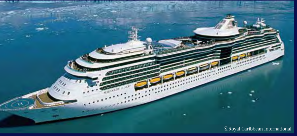
セレナーデ・オブ・ザ・シーズ (バハマ) - ROYAL CARIBBEAN INTERNATIONAL - SERENADE OF THE SEAS 90,910トン 293m 定員2,110人